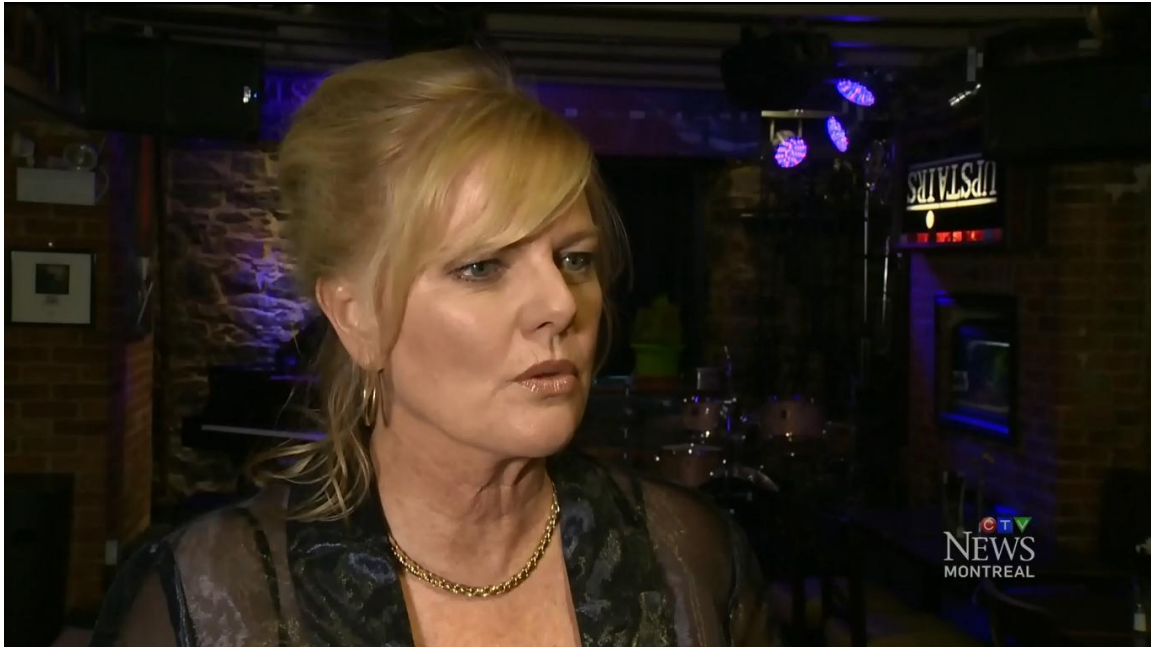
On the 6 O'clock and evening news, February 3. http://montreal.ctvnews.ca/video?binId=1.1332582